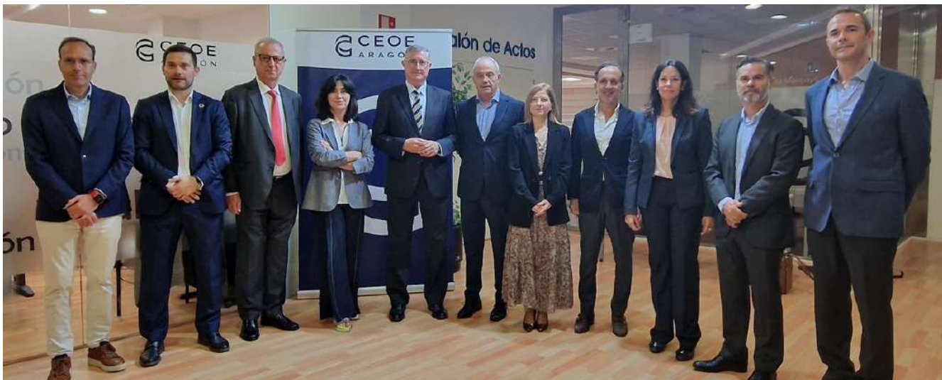
Foto de familia de todos los ponentes que intervinieron en la jornada.