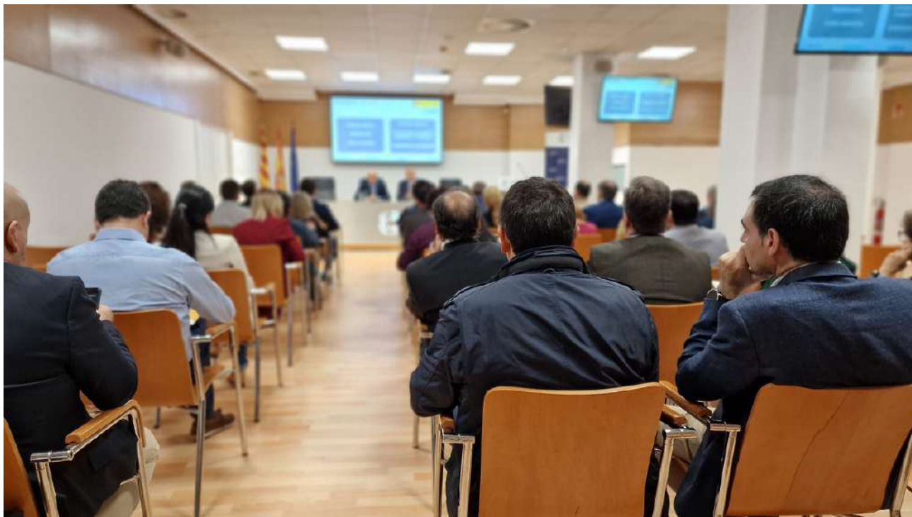
Representantes de un centenar de empresas han asistido a la jornada.

La economía circular es un modelo de producción y consumo que está muy implantada en las empresas de la Comunidad Autónoma y ha venido para quedarse. Así ha quedado patente en la jornada celebrada en CEOE Aragón, coorganizada con el Ministerio para la Transición Ecológica y Reto Demográfico (MITERD) y el Club de Excelencia en Sostenibilidad.