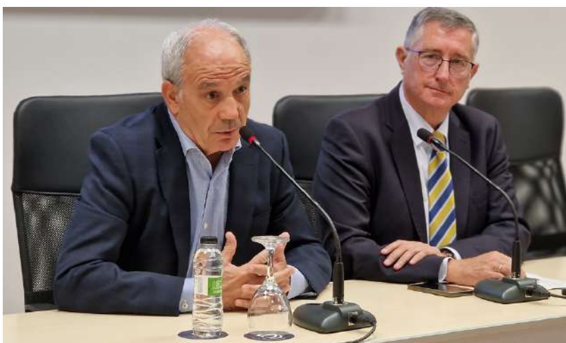
El Presidente de CEOE Aragón y el Consejero de Medio Ambiente y Turismo.