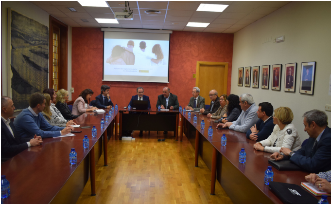
Imagen de la reunión celebrada en la sede de la Confederación.

El Director General de Migraciones del Ministerio de Inclusión, Seguridad Social y Migraciones, Santiago Yerga, ha explicado en CEOE CEPYME Huesca qué supone la reforma del reglamento de extranjería y las posibilidades que abre para la formación y contratación de trabajadores extranjeros.