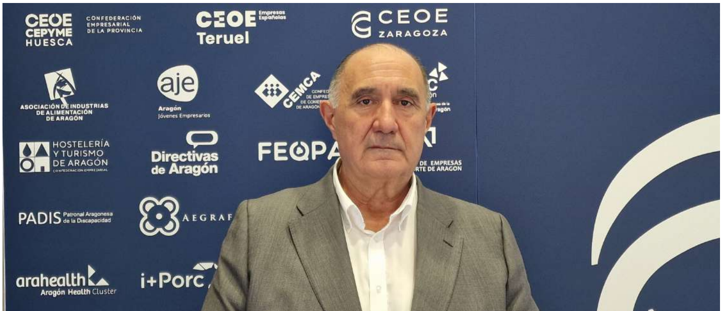
Luna, ante los logotipos de las organizaciones que forman parte de CEOE Aragón.

“Tenemos una patronal muy fuerte, que engloba a todos los territorios y sectores de la provincia”