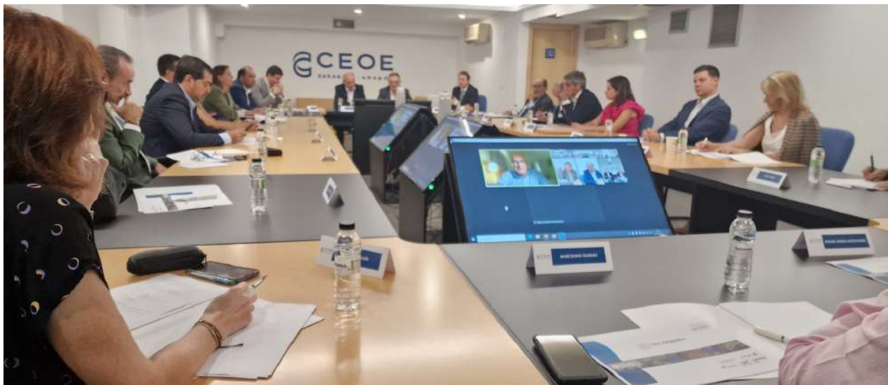
Imagen de la reunión constitutiva del Think Tank.

Servir como plataforma de generación de conocimiento y colaboración para impulsar la competitividad de Aragón y su desarrollo socioeconómico. Con este objetivo nace el Think Tank de CEOE Aragón, integrado por destacados representantes del ámbito empresarial y la sociedad aragonesa en diversos ámbitos.