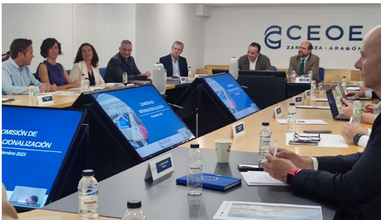
Reunión de la Comisión.

Air Horizont, Arpa, Arex, Arahealth, Aves Nobles y Derivados, Araven, Tecnoven, Bodegas Aragonesas, Cuatrecasas, Industrias Pardo, CCI Franco Española, EGI, Grupo Carreras, Sisener, Ibernex, Tereos, Evair, Idom, Enarco, Ideconsa, Cesce, Operinter, Confecciones Oroel, Geinnova, el Clúster ALIA, Caja Rural de Aragón, Ramón Rey Ardid, AIAA, Scati e Inter Ingeniería