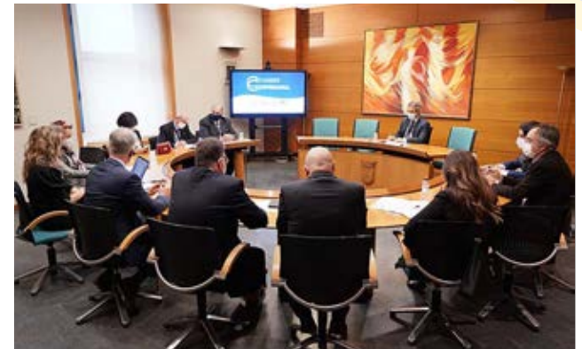
Mesa de Agroalimentación.