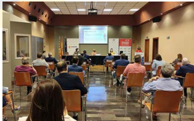
La sesión de julio estuvo dedicada a la Agroalimentación.