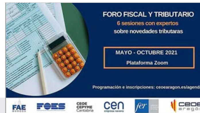
Foro fiscal y tributario.