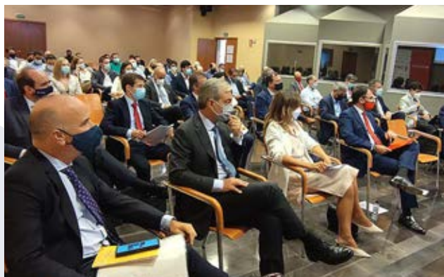
Nuestras jornadas se orientan a impulsar la competitividad y formación empresarial.