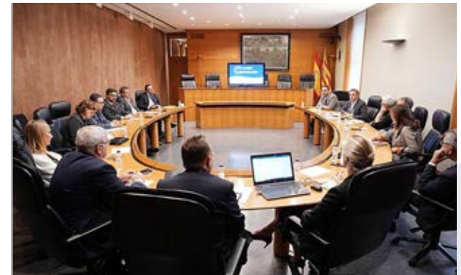
Mesa de Turismo.