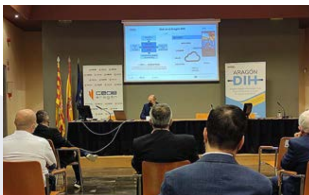
Inicio del ciclo en junio con la sesión dedicada a Automoción.