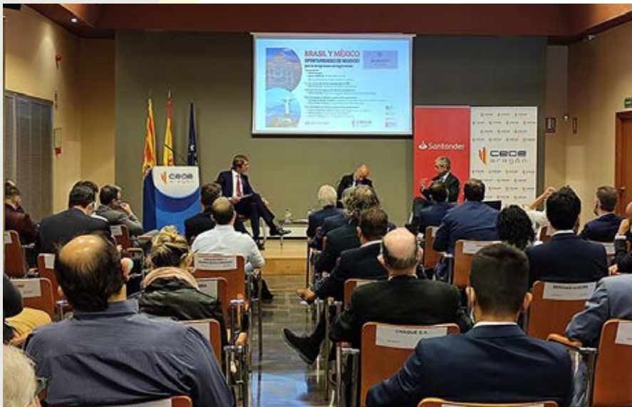
Oportunidades de negocio en Brasil y México.