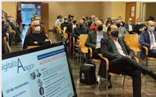
DigitalizAragón Agroalimentación, en noviembre.

Junto a aspectos más específicos vinculados a cada sector y tipo de empresa, en todos los foros se ha planteado el carácter disruptivo de la transformación digital y la importancia crucial de afrontarla con una estrategia y objetivos claros, partiendo de una adecuada medición del punto de partida, los recursos y tiempos. Así mismo, se ha puesto énfasis en que la digitalización es un medio facilitador, pero no el fin en sí misma y en que deben ser las personas (tanto equipos internos como clientes) y los procesos de la empresa los ejes sobre los que esta debe pivotar para ser eficaz, sostenible y contribuir decisivamente a mejoras competitivas.