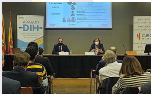
Encuentro sobre Energía celebrado en noviembre.