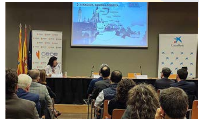
Logística y transporte, protagonistas de la jornada de noviembre.

En colaboración con CaixaBank, CEOE Aragón ha desarrollado a lo largo del año el Plan Impulsa Aragón 2021. Junto al apoyo a los proyectos empresariales en el marco del Plan Europeo de Recuperación (reseñado anteriormente), el Plan se ha centrado en dar visibilidad y fomentar el incremento de la presencia femenina en sectores estratégicos.