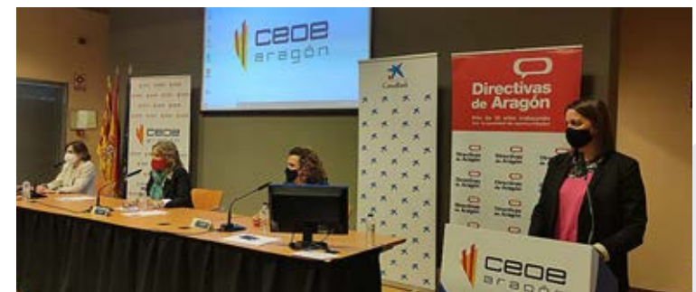
Jornada dedicada al sector industrial en mayo.

Las jornadas Impulsa Sectores Estratégicos , dedicadas a la Industria, la Agroalimentación y la Logística han analizado las tendencias y retos de futuro de cada actividad, así como la creciente incorporación de talento femenino a las empresas y su contribución a las mismas, de la mano de directivas de Argyor, FRIBIN, Magaiz, Equimodal, Orchard Fruit, Chocolates Lacasa, Cluster i+porc, Mann+Hummel Ibérica, Arkhe y ZLC. Han contado, además, con la colaboración de nuestras asociaciones miembros Directivas de Aragón, CEOS CEPYME Huesca, CEOE Teruel, CEOE Zaragoza, Asociación de Industrias de Alimentación de Aragón y Federación de Empresarios de Transporte de Aragón.