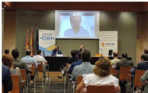
DigitalizAragón Logística, en junio.