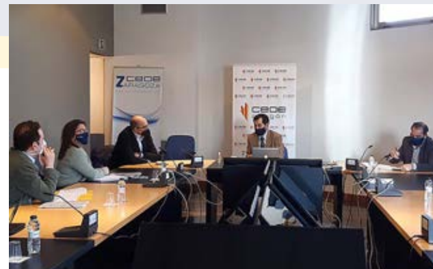
Reunión con representantes de hostelería y turismo para analizar las necesidades de ayudas para el sector.