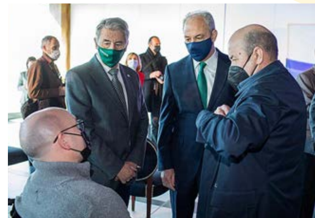
Nuestro nuevo presidente con los dirigentes del resto de agentes sociales.

El compromiso con el diálogo social y la negociación, la coordinación y unidad de acción entre las organizaciones empresariales al servicio de las empresas y la llamada a la implicación y participación activa de todas ellas en CEOE Aragón constituyen, así mismo, vectores de acción de esta presidencia que se inicia, con la sostenibilidad financiera como objetivo interno fundamental.