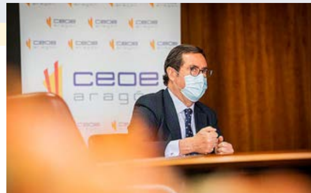
El presidente de CEOE, Antonio Garamendi, en una de sus visitas a CEOE Aragón este año.

Desde sus primeros pasos en 2020, hemos sido muy conscientes de la importancia que acceder al mayor volumen de fondos Next Generation del Plan de Recuperación de la Unión Europea tiene para apoyar a las empresas y la economía autonómica. Por ello, hemos liderado la dinamización e impulso de proyectos empresariales que puedan optar a ellos, y buscado tanto dejar patente la fuerza y potencialidades de nuestro tejido productivo como propiciar la orientación autonómica y sectorial más beneficiosa para Aragón de las convocatorias que deben articularlas en España. 150 proyectos empresariales con previsión de más de 3.600 millones de inversión y 40.000 empleos, hemos logrado reunir y presentar al Gobierno de Aragón a través de nuestro Servicio de Apoyo a la Elaboración de Proyectos Empresariales en el marco del Plan Europeo de Recuperación, respaldado en distintas fases por CaixaBank e Ibercaja.