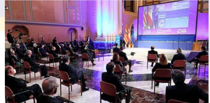
Imagen de la V Cumbre Empresarial por la Competitividad de Aragón con la vicepresidenta Calviño en su intervención.