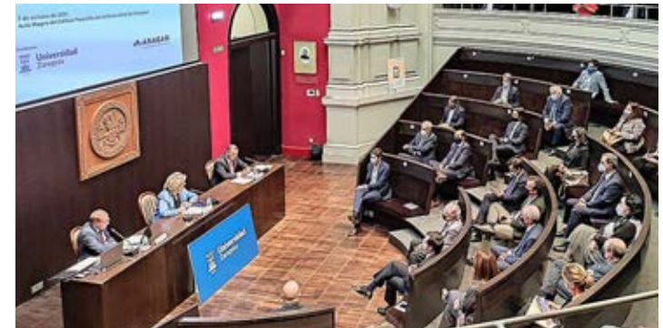
Jornada sobre competitividad y empleo organizada por el Consejo junto a la Universidad de Zaragoza y ANAGAN.