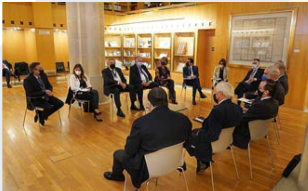
Mesa de Logística.

favorecer la actividad empresarial. Todo ello se hizo público en un plenario con representación de los cuatro gobiernos autonómicos al máximo nivel y tras cuatro mesas sectoriales dedicadas a Industria, Turismo, Agroalimentación y Logística.