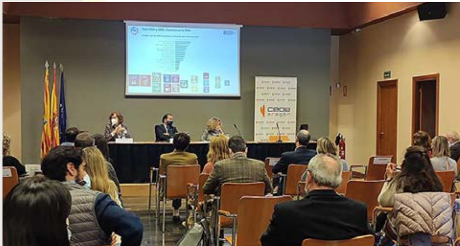
Jornada sobre sostenibilidad empresarial junto a la Red Española del Pacto Mundial y el IAF.