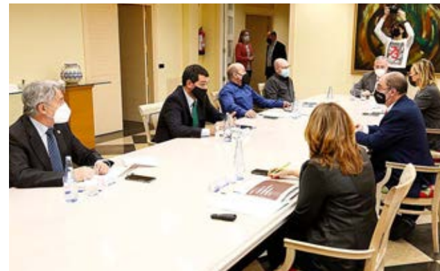
Reunión de los agentes sociales con el Presidente del Gobierno de Aragón.