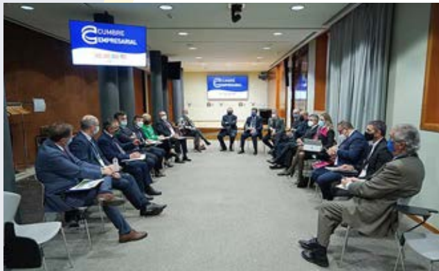
Mesa de Industria.