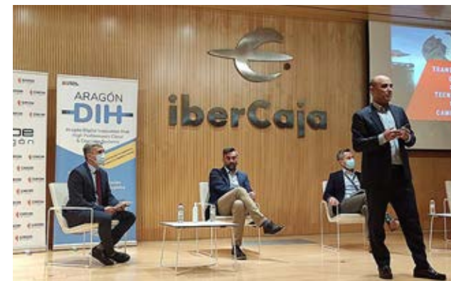
El director general de Inycom, durante su intervención en una de las mesas del Foro Aragón Liderazgo Digital 2021.