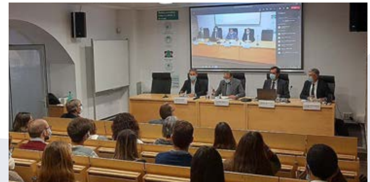
Inauguración del Máster en Dirección y Gestión de Empresas de la USJ respaldado por el Consejo Empresarial.