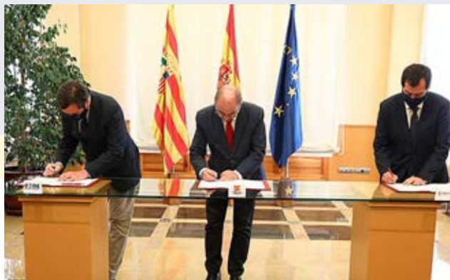
Firma del Plan Sumamos por los presidentes del Gobierno de Aragón, CEOE y CEOE Aragón.