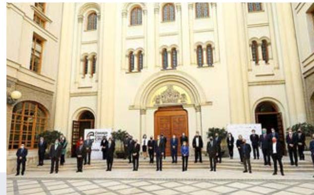
Foto de familia con todos los galardonados en la 5ª Cumbre por la Competitividad.