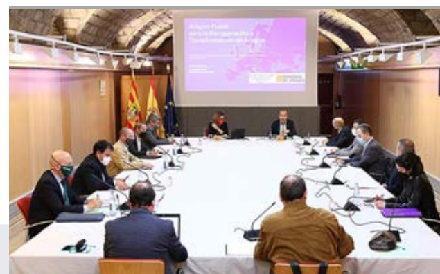
Seguimiento de la Estrategia Aragonesa para la Recuperación.