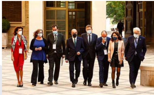
Máximos representantes empresariales y políticos de Baleares, Comunidad Valenciana, Cataluña y Aragón, entrando al plenario.