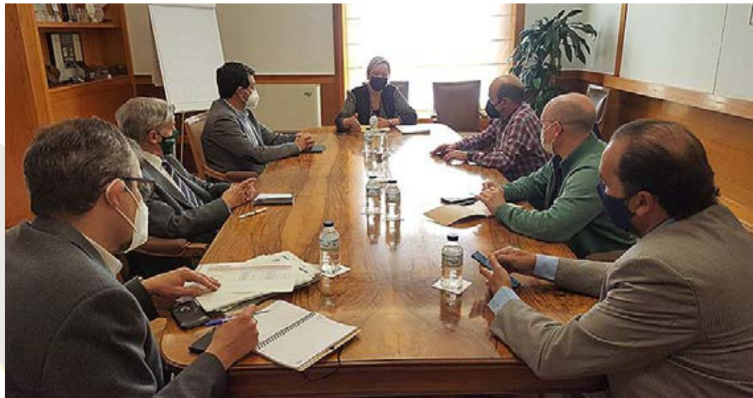
Mesa Empleo Juvenil Agentes sociales.