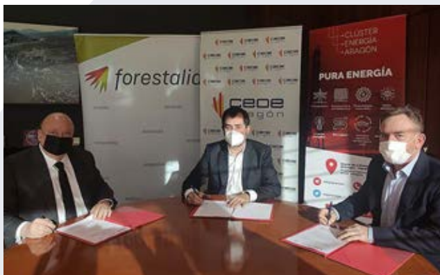
Firma del acuerdo entre los presidentes de Forestalia, CEOE Aragón y el Clúster CLENAR.

Establecer y potenciar sinergias con empresas y entidades en beneficio de las empresas aragonesas es otra de las líneas de actuación que se han desarrollado de forma estable en el último ejercicio.