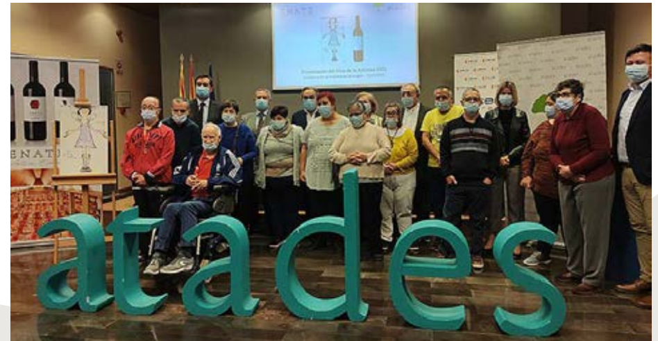
Presentación del Vino de la Amistad de ATADES.