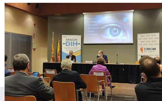
Sesión dedicada al sector de Salud, en septiembre.