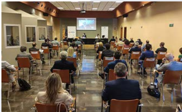
Jornada dedicada al Plan España Puede y los fondos europeos, con intervención del director general de Industria y Pyme del Ministerio.