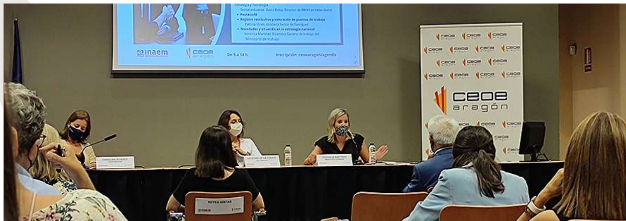
Las directoras generales de Trabajo del Ministerio (dcha.) y el Gobierno de Aragón (centro) participaron en la sesión sobre igualdad y diálogo social.

El área también apoya a la de Internacional en la labor de CEOE Aragón como embajadora de la Agencia Europea de Seguridad y Salud en el Trabajo en España.