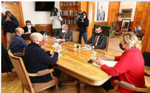
Encuentro sobre programas de empleo entre la Consejera y los representantes de los agentes sociales.