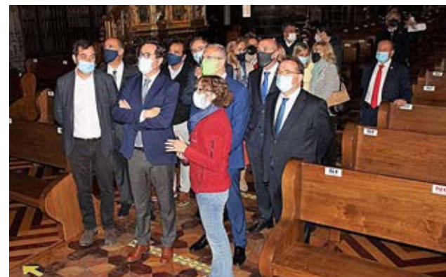
Visita a la Catedral de Jaca y San Juan de la Peña con Antonio Garamendi dentro de la iniciativa El Camino de las Empresas.