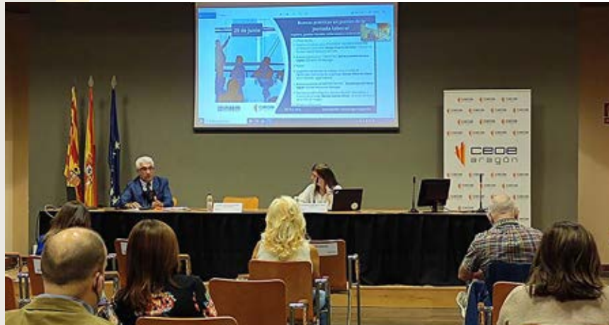
Jornada sobre negociación colectiva y gestión de jornada.