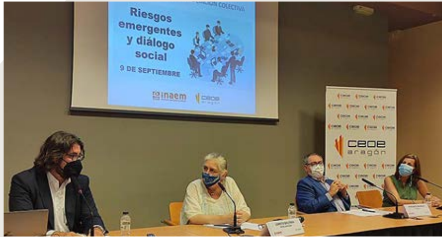
Jornada de buenas prácticas en prevención de riesgos emergentes y diálogo social.