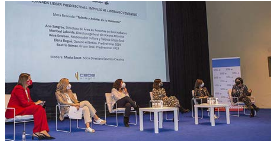
La colaboración con Directivas de Aragón e Ibercaja en los programas LiderA ayudan a impulsar el liderazgo femenino.