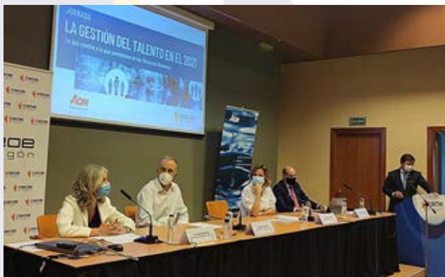
Jornada sobre gestión del Talento.