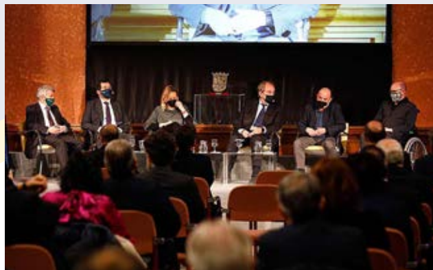
Mesa redonda de los agentes sociales junto a los consejeros de Hacienda y Economía.