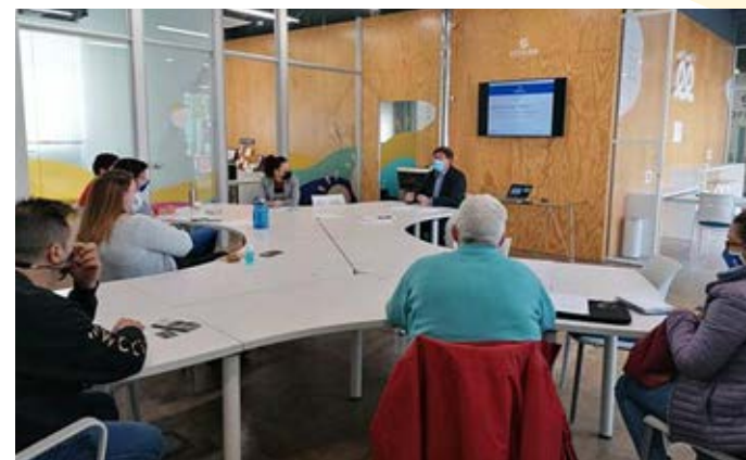
Sesión informativa Consolida Pyme.

2.- Emprendimiento social y acción social. Incluyendo el proyecto de detección de necesidades sociales y digitales en población vulnerable demandante de empleo, con apoyo del Ayuntamiento de Zaragoza, el programa de apoyo al emprendimiento social e inclusivo y la participación en la mesa de expertos del programa Emprendimiento social del Instituto Aragonés de Fomento.